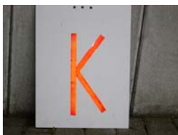
Besetzte Kontrolle (Stempel)