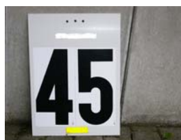
Unbesetzte Kontrolle (Zahl selber eintragen)