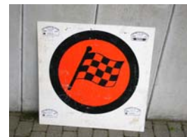
Ziel GLP´s und Ziel