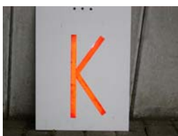
Besetzte Kontrolle (Stempel)