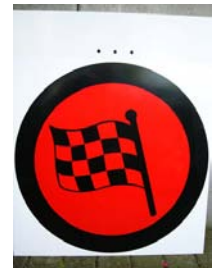
Mittagspause EIN und AUS