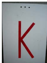
Besetzte Kontrolle (Stempel)