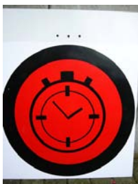
Mittagspause EIN und AUS