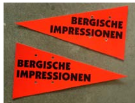
Richtungspfeile auf der SZP und Umleitungen