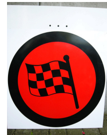
Ziel SZP und Ziel