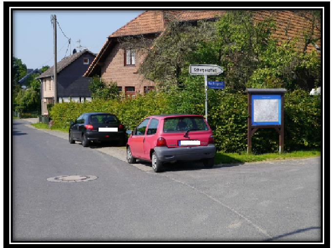
Zu Frage 4