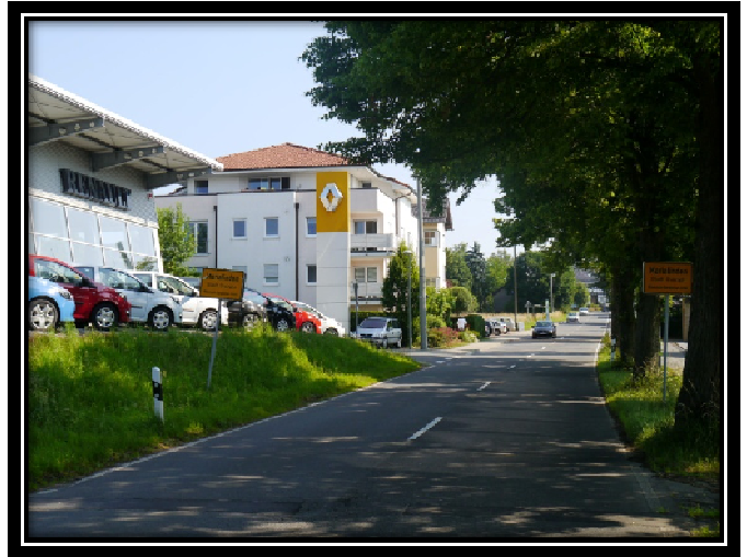
Zu Frage 2