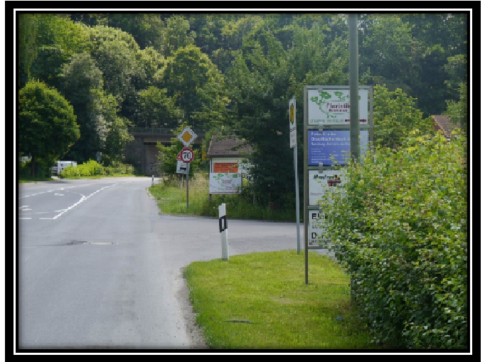
Zu Frage 8