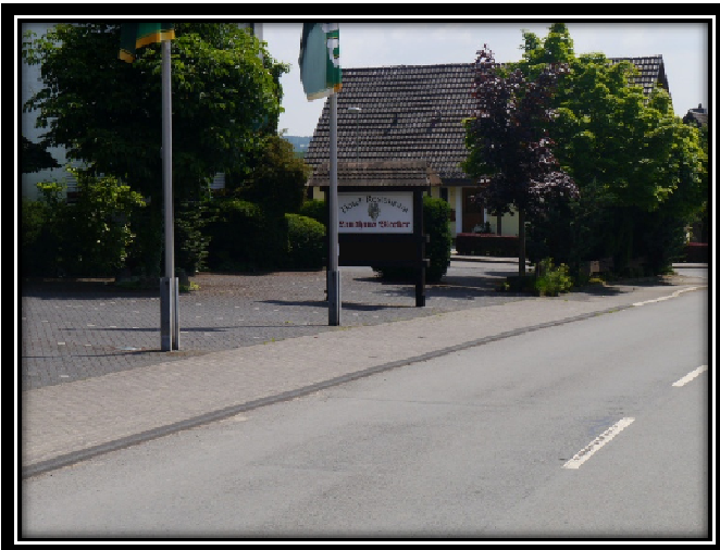
Zu Frage 9