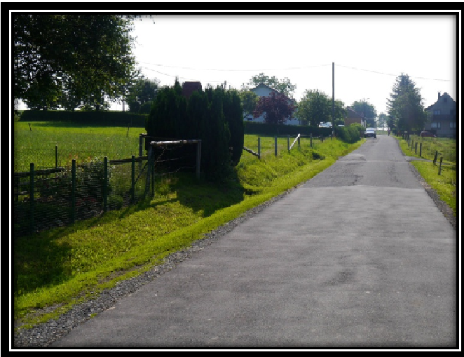
Zu Frage 3