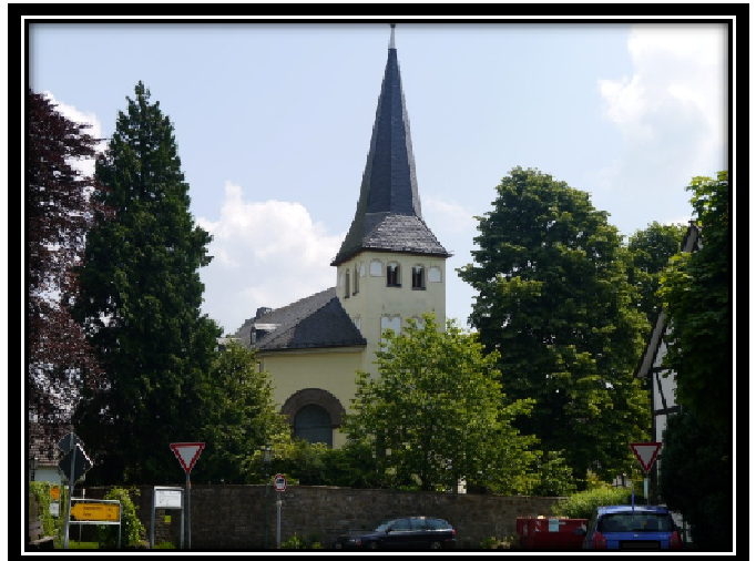
Zu Frage 10