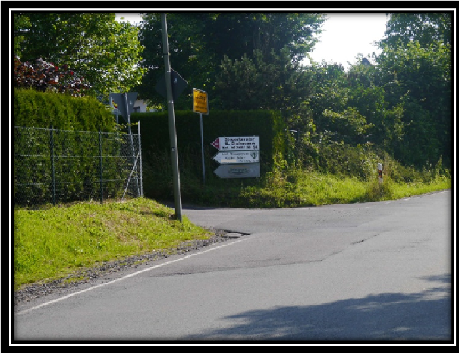
Zu Frage 1