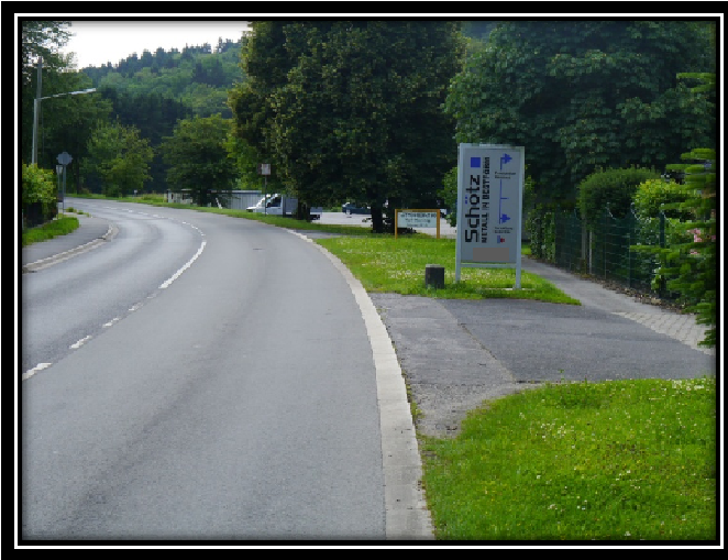
Zu Frage 7