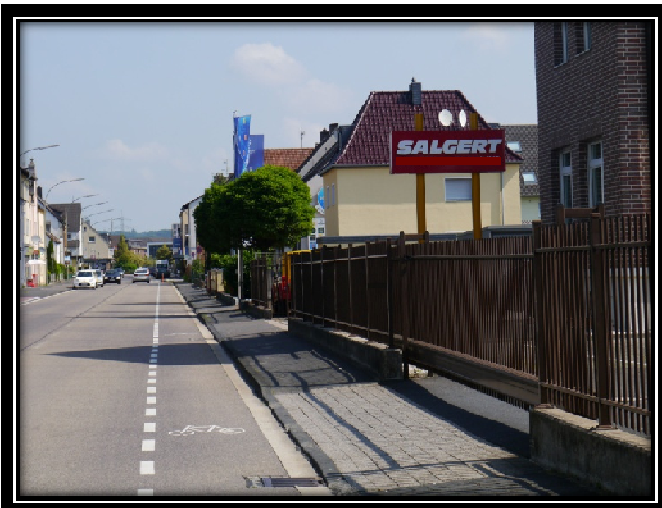
Zu Frage 5