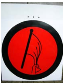
START UND START SZP