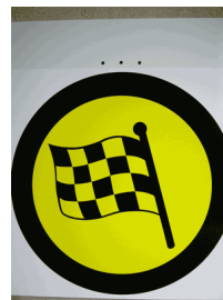
Ziel SZP und Ziel