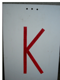
Unbesetzte Kontrolle (Zahl selber eintragen)