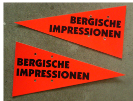
Richtungspfeile auf der SZP und Umleitungen