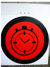
Besetzte Kontrolle (Stempel)