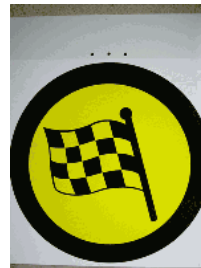
Vorankündigung Ziel SZP