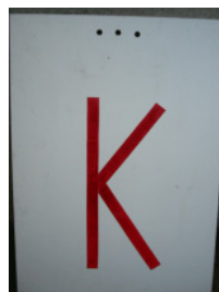
Besetzte Kontrolle (Stempel)