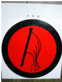
Start und Start SZP