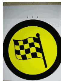
Vorankündigung Ziel SZP