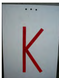
Besetzte Kontrolle (Stempel)