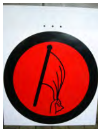
Start und Start SZP