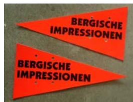
Richtungspfeile auf der SZP und Umleitungen