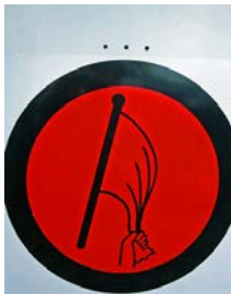
Start und Start SZP