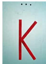
Besetzte Kontrolle (SK) (Stempel)